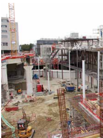
Le paysage construit prend forme au Nord-Est de la gare. À gauche, la gare routière.

Mylène Moreau, nouvelle directrice des gares de Bretagne