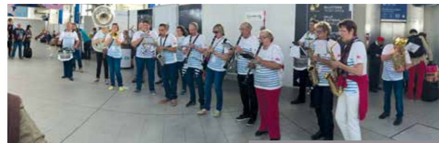
Fanfare d'accueil en gare de Rennes