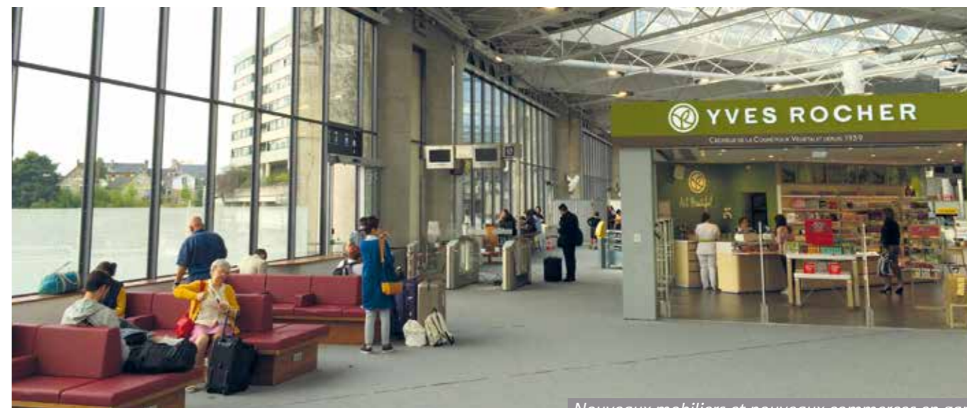
Nouveaux mobiliers et nouveaux commerces en gare

Depuis début juillet, la gare met à disposition des voyageurs de nouveaux espaces, équipements et services. Tour d'horizon.