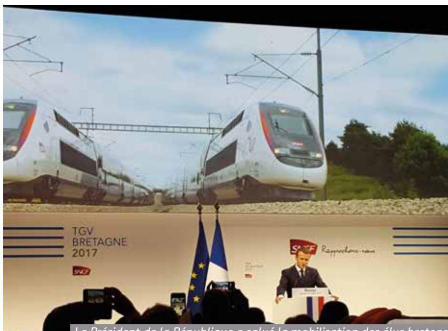
Le Président de la République a salué la mobilisation des élus bretons